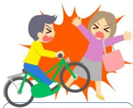
交通等傷害共済 あんしんセット